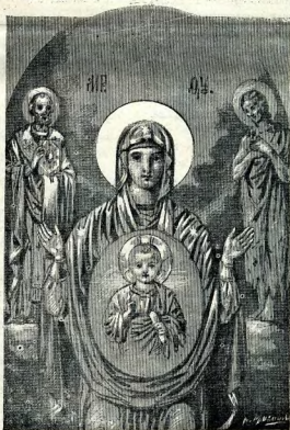
Абалакская икона Божіей Матери.

ОЛГОЕ время Абалакскій приходъ и храмы были скудны материальными средствами, что явствуетъ изъ того, что первоначальныя постройки сооружались на царскія деньги, а потомъ на средства жертвователей. Материально возвышаться стали абалакскіе храмы съ 1783 г. Въ этомъ году приходъ на Абалакѣ былъ закрытъ и переведенъ въ Преображенское село, въ 4 хъ верстахъ отъ Абалана, по тракту въ Тобольскъ, гдѣ съ этою цѣлю выстроена была (въ 1784 г.) новая каменная церковь во имя Преображенія Господня. Сюда же, т. е. въ Абалакъ, въ 1783 г. преосвященный епископъ Варлаамъ I-й (Петров), по Высочайшему казу (2 июля), перевелъ изъ