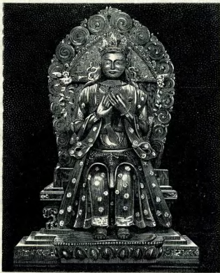
Бурятское божество (Будда).

только, а мѣстами свидѣтельствуютъ въ ежедневной жизни испытываютъ цѣля бѣдствія и голода. Кое-какіе хлѣба и хлѣбковъ, а также почти совсѣмъ. Не только изданы необходимые дожитки и привозимыя хозяйственныя проданы, частію за безцѣнокку хлѣба. Исху, безкормицы и скотъ, главный крестьянской задается со двора отдается за безцѣннымъ скупица на городскакъ Братся болѣе крестьянину въ постигнутыхъ неурожаемъ, остне за что, чтобы скудное прописвоей голодающВсѣмъ за крначиваютъ истинсей силѣ указаствие и сельскоество; вмѣсто тоободрайтъ и утѣихъ прихожанъ, терлется, не зна